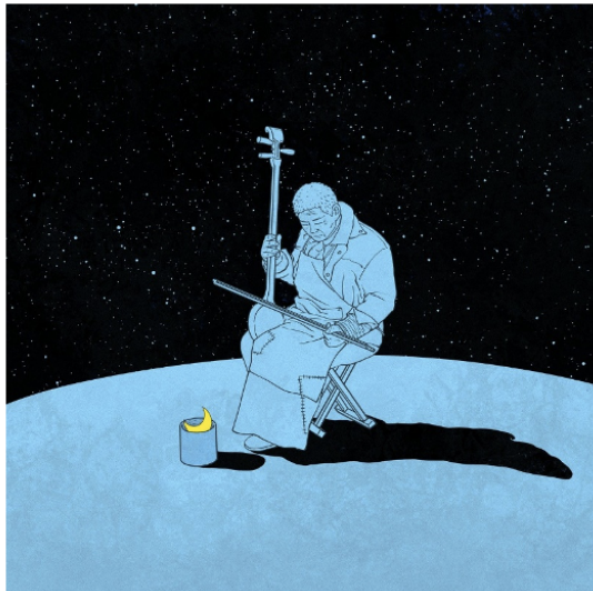
(a) Homme jouant du erhu.